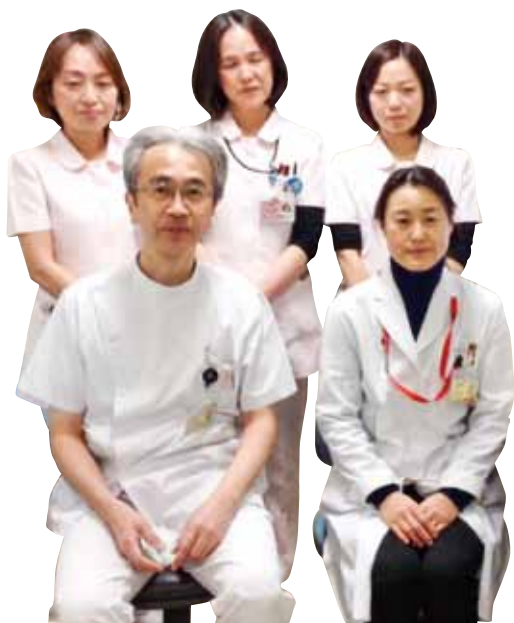
禁煙外来スタッフ

今は自己責任の時代です。自分の健康は自分で守る必要があります。流行に流されることなく、信頼できる情報を入手し、自分の判断で行動しましょう。