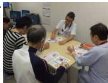
心臓病教室の風景

平日毎日約20分程度開催されており、教室には患者さんだけでなくご家族の方も参加できます。