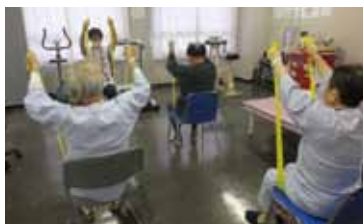
心臓リハビリテーションの風景

運動の実施については、週に3~5回の頻度で、1回につき40分前後の運動を行っております。