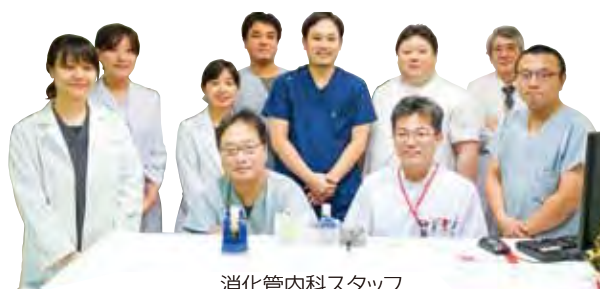
消化管内科スタッフ