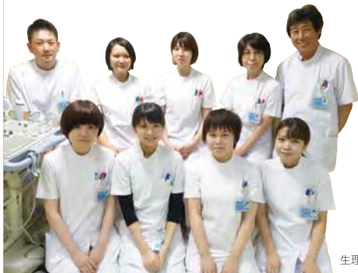
生理検査室スタッフ