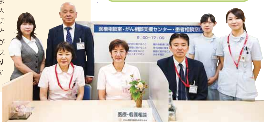
患者相談窓口 担当スタッフ

月曜日から金曜日は9時～17時、土曜日は9時～13時まで、いつでもご相談を受けております。窓口にお見えになった方だけではなく、電話やメールでの対応も行なっております。担当のベテラン看護師や医療ソーシャルワーカー、医療メディエーターが専門的な知識・技術に基づき問題解決ができるように努めます。また、その内容に応じて、適切な部署や職種と連携をとりながら、より良い解決の糸口を見出すお手伝いをしております。