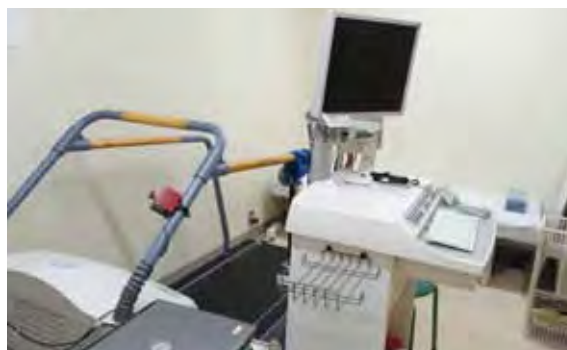
検査室(トレッドミル室)