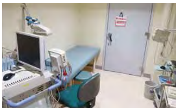
シールドルーム(脳波室・筋電図室・聴力室)