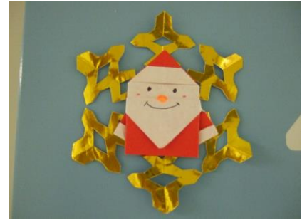
(12月・サンタクロース)